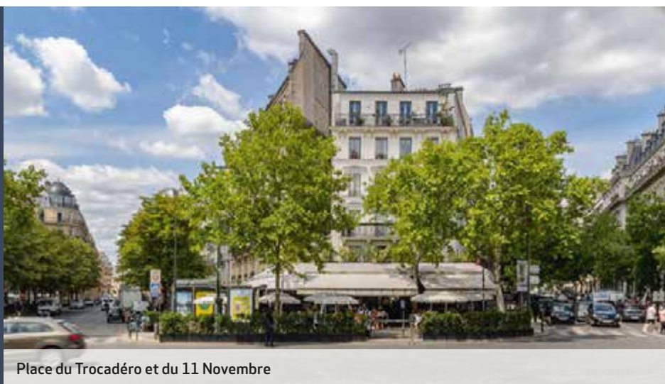
Place du Trocadéro et du 11 Novembre

Aux 77-79 rue de la Pompe, le bien est situé entre le quartier de la Muette et le quartier de la Porte Dauphine, proche de tous les avantages.