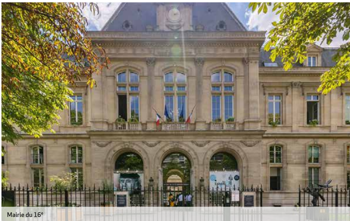
Mairie du 16 e