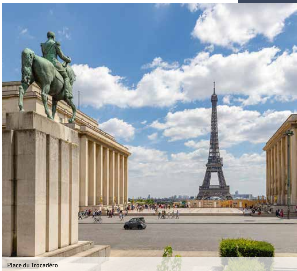
Place du Trocadéro