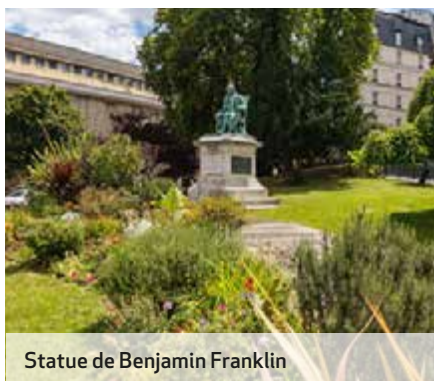
Statue de Benjamin Franklin

Les Jardins du Trocadéro contemplant la majestueuse Tour Eiffel, la Place de l'Étoile dominée par l'Arc de Triomphe ou encore le Pont de Bir-Hakeim, aperçu dans de nombreux longs métrages... voici autant de lieux parisiens incontournables à retrouver au sein du 16 e arrondissement. Il compte aussi parmi les artères les plus emblématiques de la Ville Lumière : Foch, Marceau, Kléber, des noms synonymes d'élégance et de luxe.